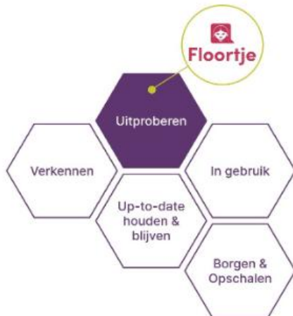
Figuur 1: Het Honingraatmodel (Suijkerbuijk, S., et al. (2021). Technologie implementeren met het honingraatmodel.) Floortje bevindt zich in de uitprobeerfase.